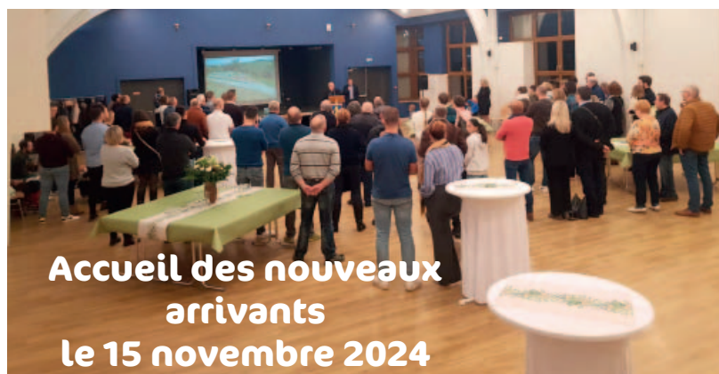
Accueil des nouveaux arrivants le 15 novembre 2024