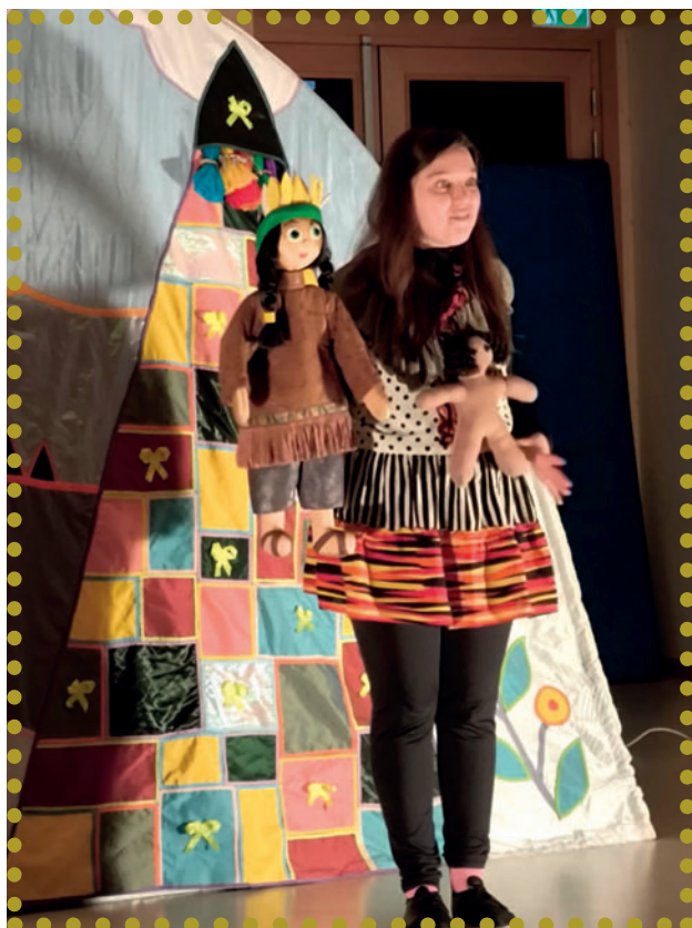
Anoki, magicien des couleurs a fait apparaître un arc-en-ciel.