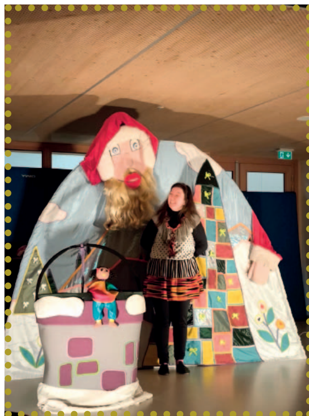
Le Père Noël a apprécié le cadeau très spécial réalisé par les enfants du monde, avec un petit coup de pouce des élèves !