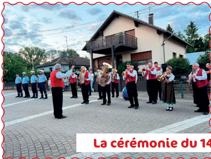
La cérémonie du 14 juillet