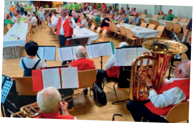
Aubades pour anniversaires