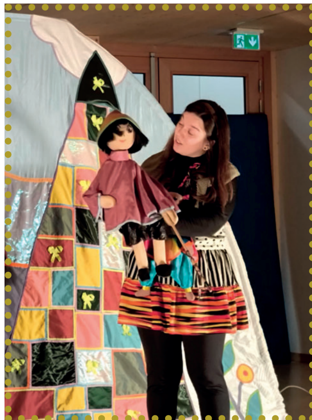
Ting est allé à la pêche à la lune,